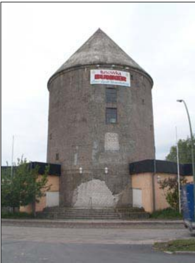
Trollsee-Lager I bunkeren.

Den bliver brugt til technofester hver fredag aften.