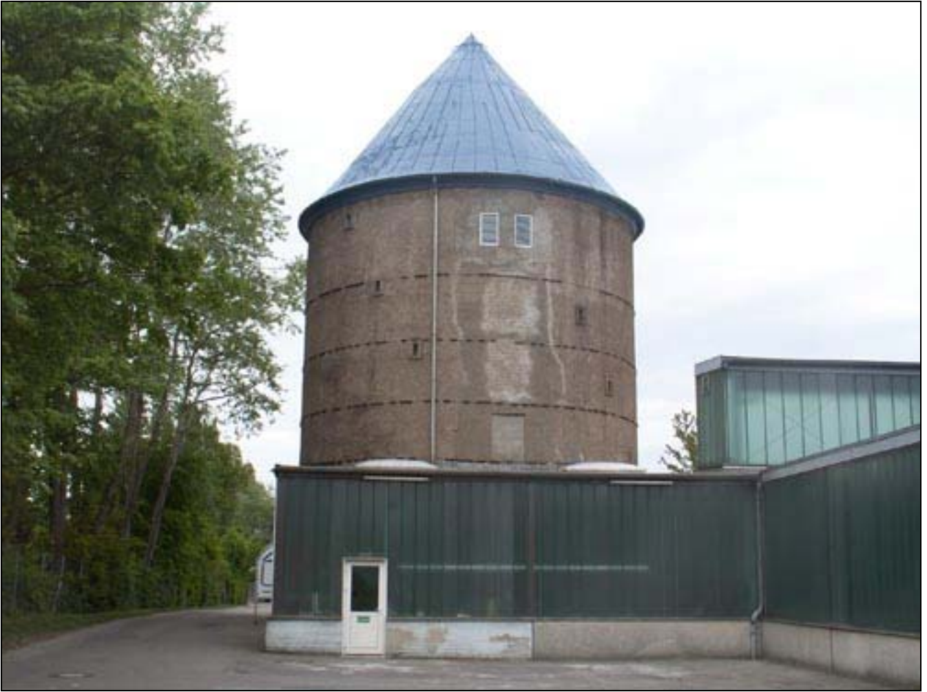
Trollsee-Lager II Luftbeskyttelsestårnet. Bruges til kunststillinger af institutionen Holländerhof. 2005.