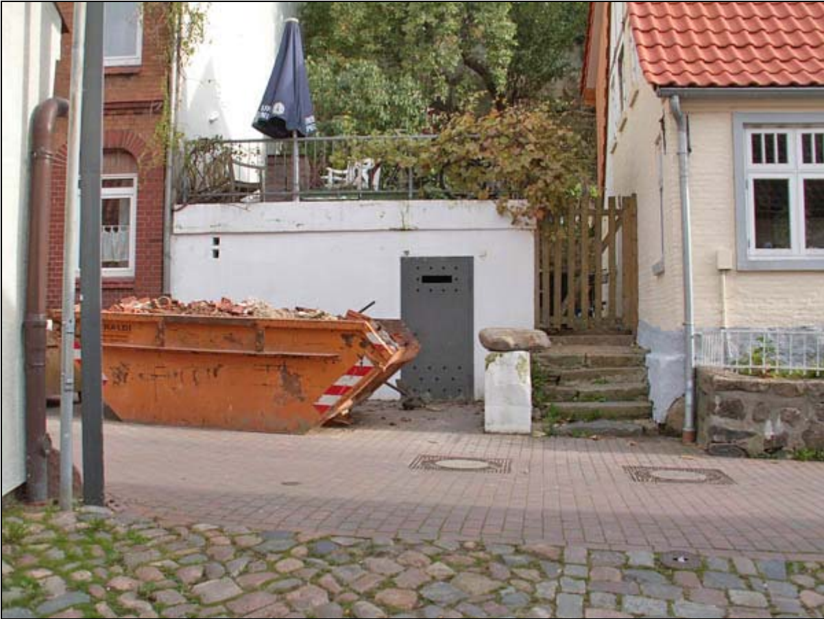
Den sydlige indgang til Pilkentafel-stollen. Beliggende ud til St.-Jürgen-Strasse overfor stien med navnet Pilkentafel. Indgangen er aflåst. 2006.