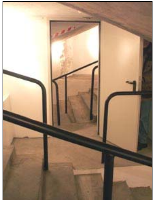
Nyindrettet væg og gennemgang hvor de to trapper ses. 2006.