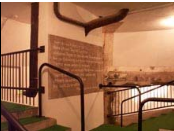
Trollsee-Lager II Luftbeskyttelsestårnet indvendigt. Øverste etage hvor de to trapper mødes. 2006.