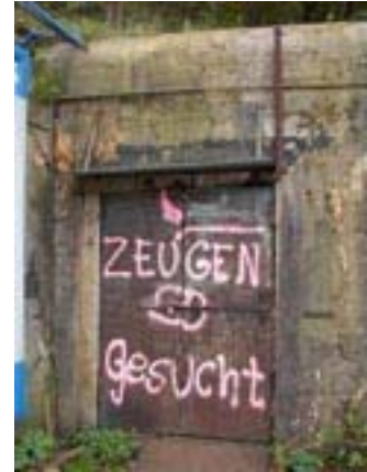
Den lange bunker ud til vejen Kielseng på østsiden af havnen. Som det ses er bunkeren camoufleret med et stakit med reklamer på. Grafittiet på bunkerdøren betyder: "Vidner søges"! 2006.