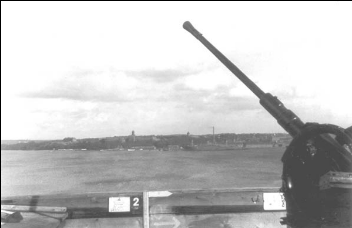
Udsigt fra en 20 mm antiluftskytsskanon tværs over Flensborg Inderfjord mod Marineschule Flensburg-Mürvik under 2. verdenskrig. Tilsyneladende har stillingen ligget i nordkanten af Flensborg på kystskrænten i parken ved Ostseebad tæt på den sydlige ende af Apenrader Chaussee.